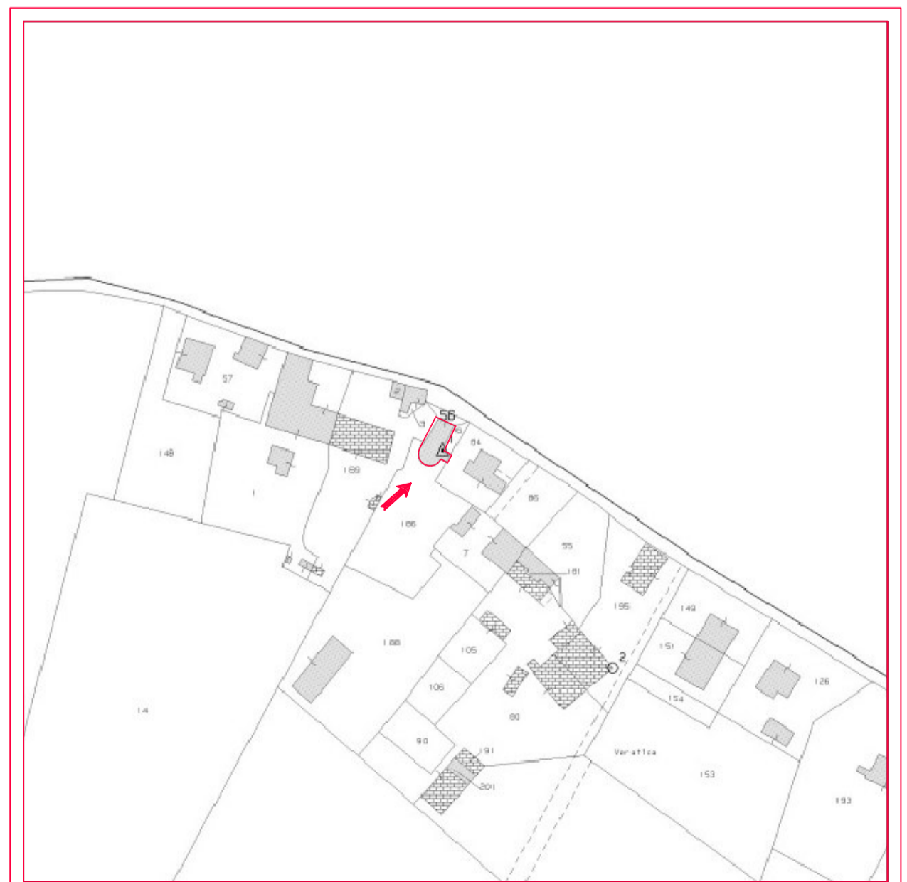
MAPPA CATASTALE - Scala 1:2000 Comune Censuario di Salara - foglio 10 - mappale 56