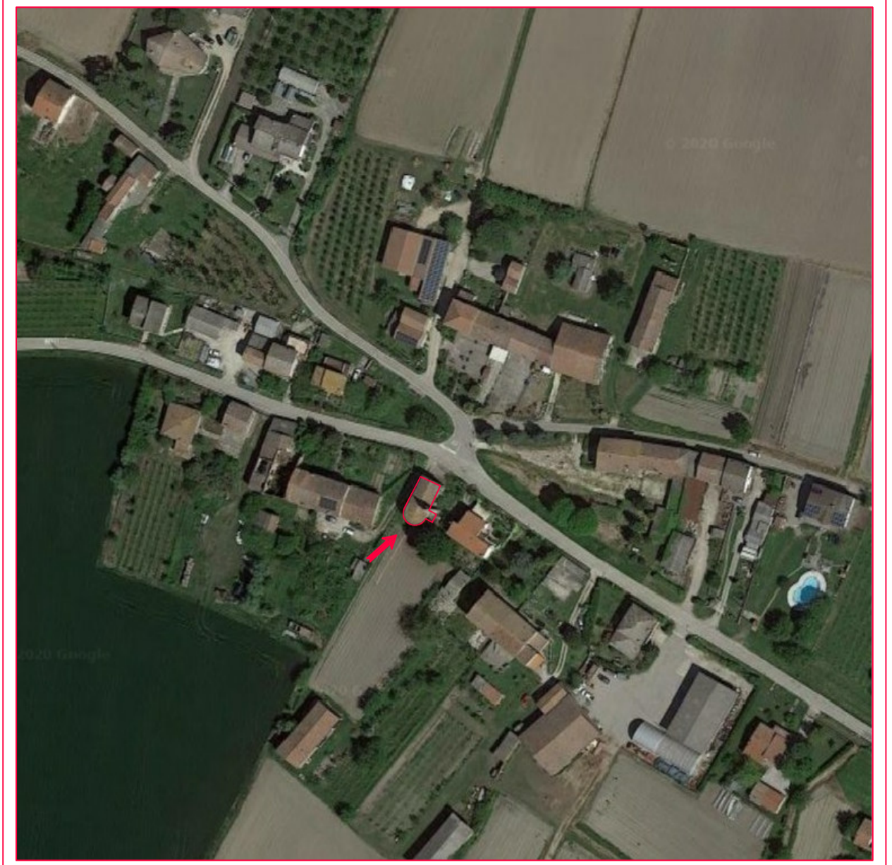
FOTOPIANO - inquadramento generale