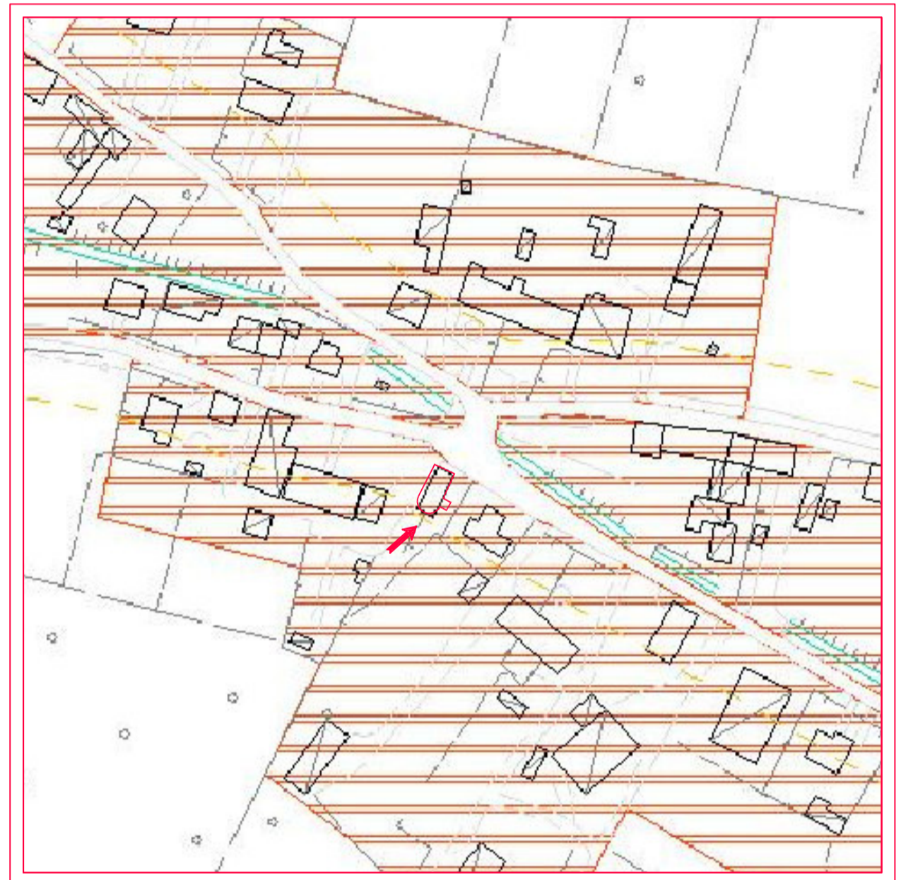
ESTRATTO DI PRG